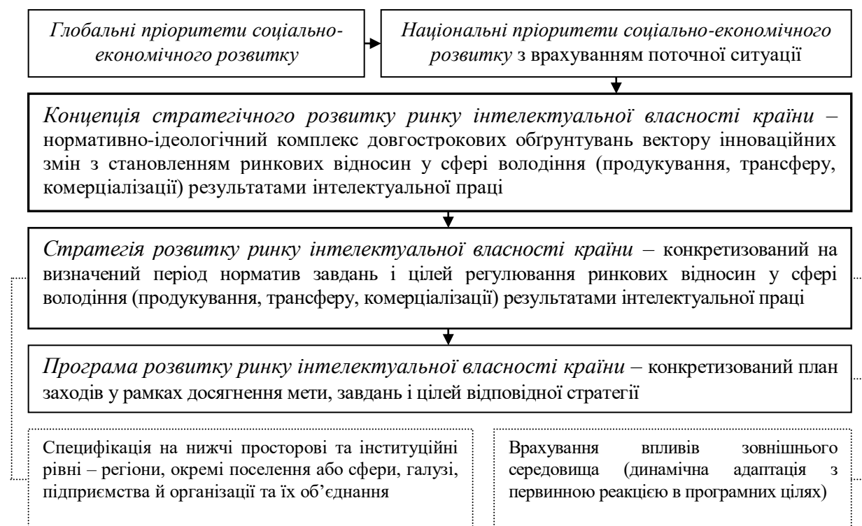
Рис.2. Концепція стратегічного розвитку ринку інтелектуальної власності країни: зміст та місце в системі нормативних пріоритетів

економічної конкуренції та публічного управління, що у вертикалі впливу слугує вищим цілям інноваційного розвитку (рис. 2).