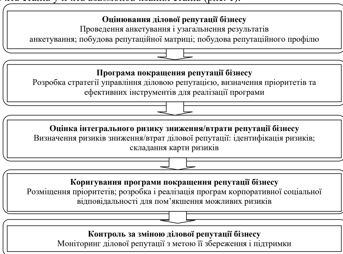
Рис. 1. Схема покращення управління діловою репутацією бізнесу з орієнтацією на соціальну відповідальність

За результатами дослідження встановлено, що механізм управління діловою репутацією з орієнтацією на соціальну відповідальність спрямований на ефективний розвиток ділової репутації підприємства, повністю відповідає сучасним вимогам, забезпечує вищий рівень економічної безпеки, створює можливості для швидкого ухвалення управлінських рішень, враховує динаміку кон'юнктури ринку та створює можливості для гнучкого реагування на ринкові зміни. В роботі представлено комплекс послідовно здійснюваних заходів щодо формування, підтримки, захисту та перспективного розвитку й підвищення ділової репутації, згрупувавши дев'ять етапів у п'ять взаємопов'язаних етапів (рис. 1).