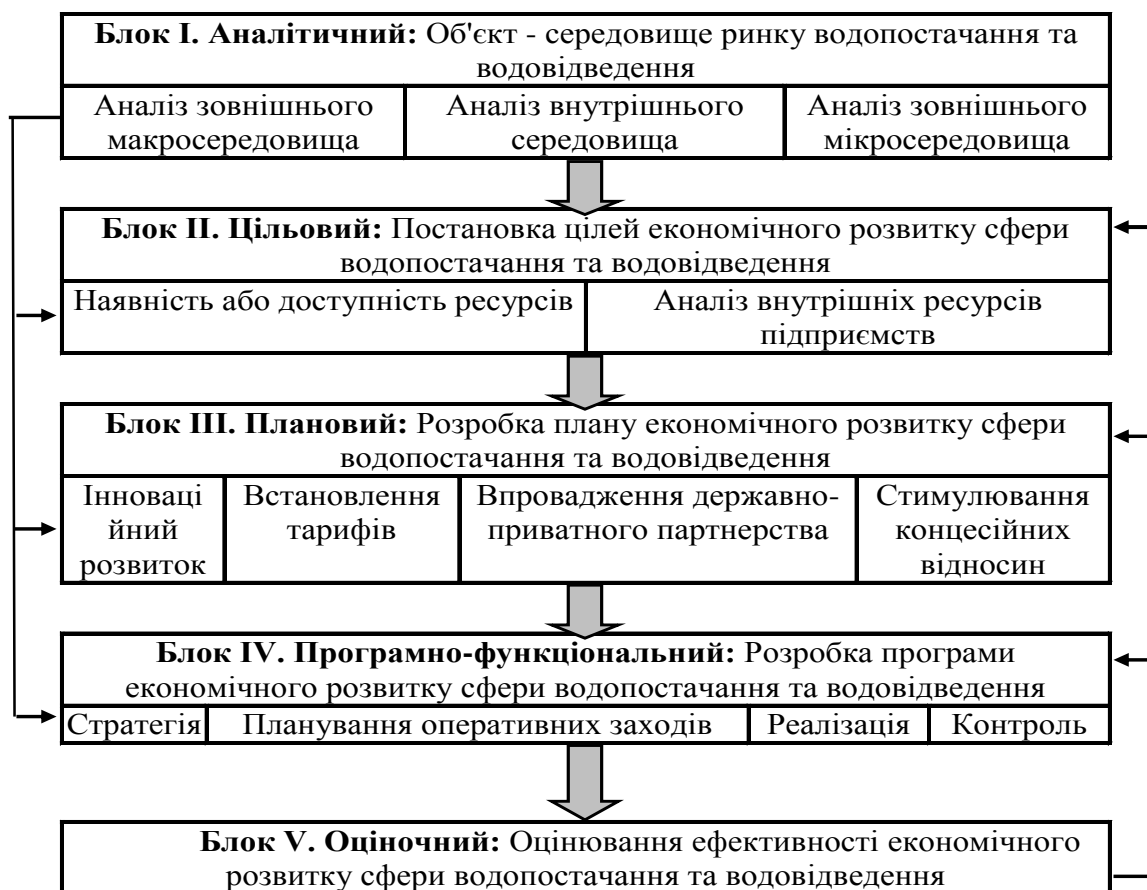
Рис. 3. Механізм розробки і реалізації державної політики економічного розвитку сфери водопостачання та водовідведення