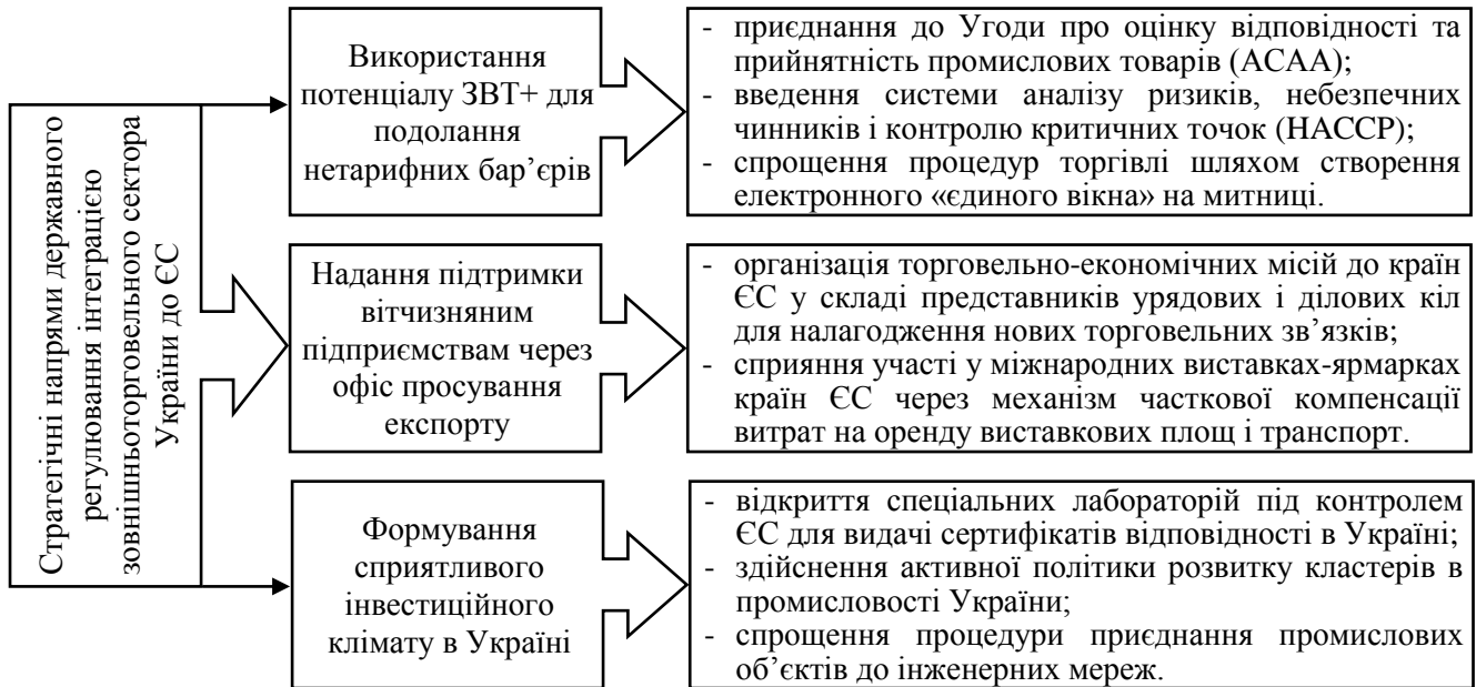
Рис. 3. Стратегічні напрями та заходи оптимізації державного регулювання інтеграцією зовнішньоторговельного сектору України до ЄС

ці витрати перебувають в межах 3-5%. Ключовим заходом зі спрощення процедур торгівлі має стати відкриття «єдиного вікна» на митниці як електронної платформи для забезпечення документообігу між суб'єктами ЗЕД та рядом підзвітних різним відомствам державних регуляторних структур, які так чи інакше впливають на функціонування зовнішньоторговельного сектору України.