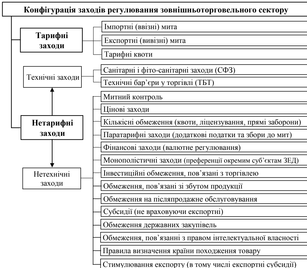
Рис. 1. Конфігурація інструментів регулювання зовнішньоторговельного сектору

сфері визначає складну конфігурацію тарифних і нетарифних заходів, що чинять прямий або опосередкований, стимулюючий або обмежуючий вплив на динаміку торговельно-економічних відносин між національними економіками, у тому числі в рамках інтеграційних об'єднань (рис. 1).