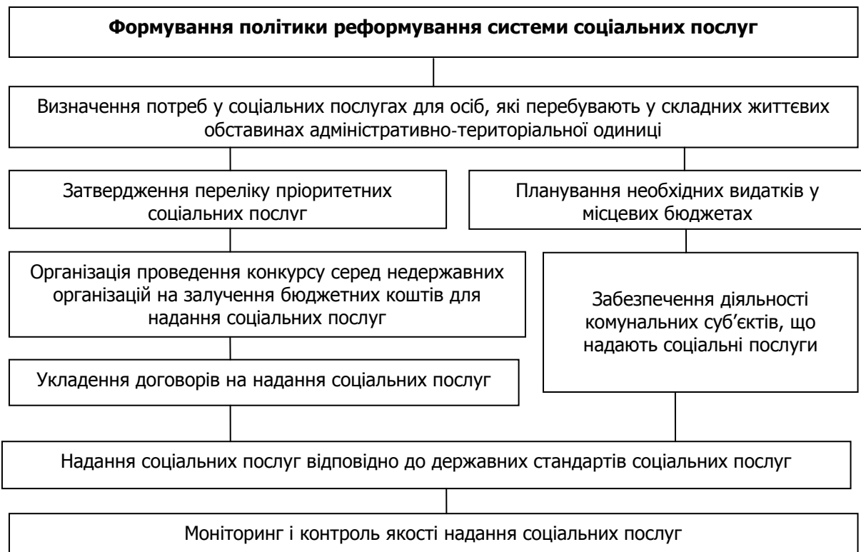
Рисунок 1. Формування моделі ринку соціальних послуг в Україні

Підвищення якості й ефективності послуг у соціальній сфері – нове завдання, яке поставлене урядом на шляху формування соціально орієнтованої держави. З метою його реалізації з 2012 р. було розпочато процес реформування сфери соціальних послуг шляхом започаткування підґрунтя для формування моделі конкурентного ринку соціальних послуг та через модернізацію діючої інфраструктури (рис. 1).