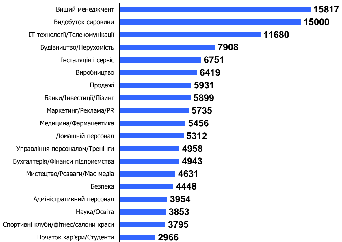
Таблиця 1. Середні зарплатні побажання пошукачів у 2013 році

Зарплатні побажання пошукачів у 2013 р. знаходилися на рівні 5–6 тис. грн., що на 15–20% вище середніх зарплатних пропозицій. Найвищі зарплатні побажання озвучували управлінці й ТОП-менеджери. Високі зарплатні побажання також у тих, хто працює в сфері видобутку сировини й інформаційних технологій. Найбільш скромні вимоги – в молодих спеціалістів, адміністративного персоналу, наукових співробітників, працівників сфери краси й спорту (див. табл. 1).