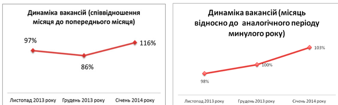
Таблиця 3. Динаміка вакансій

Найнижчі значення і найбільша затребуваність спеціалістів традиційно спостерігається в таких професійних сферах, як: продаж – 1,7; ІТ, Телеком – 1,3; виробництво – 2,5; медицина – 1,3; страхування – 1,1. І хоча список професійних сфер незмінний, але абсолютні значення дещо вищі порівняно з груднем 2013 року. Ситуація в країні також відобразилась і на регіональному ринку праці. В січні місяці мали місце нетрадиційні вакансії із порівняно