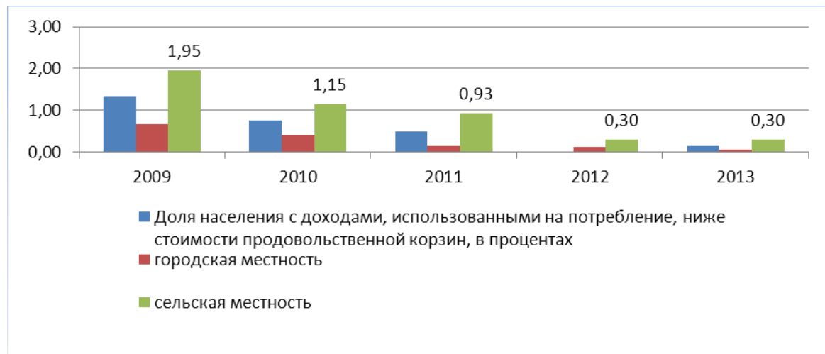
Рисунок 1. Доля населения с доходами ниже стоимости продовольственной корзины в разрезе местностей на 2013 год (составлено по данным источника [2]).

Государственная политика в отношении снижения уровня бедности в Казахстане декларируется как такая, что должна быть направлена не только на тех, кто уже находится в состоянии абсолютной бедности, но также способствовать предотвращению рисков наступления бедности. Для того чтобы определить, кто находится в зоне риска оказаться абсолютно бедным, рекомендуется использовать пороговое значение уровня дохода, равное двум размерам прожиточного минимума. Прожиточный минимум представляет собой минимальный денежный доход на одного человека, равный по величине стоимости минимальной потребительской корзины, которая состоит из стоимости продовольственной корзины и расходов на непродовольственные товары и услуги.