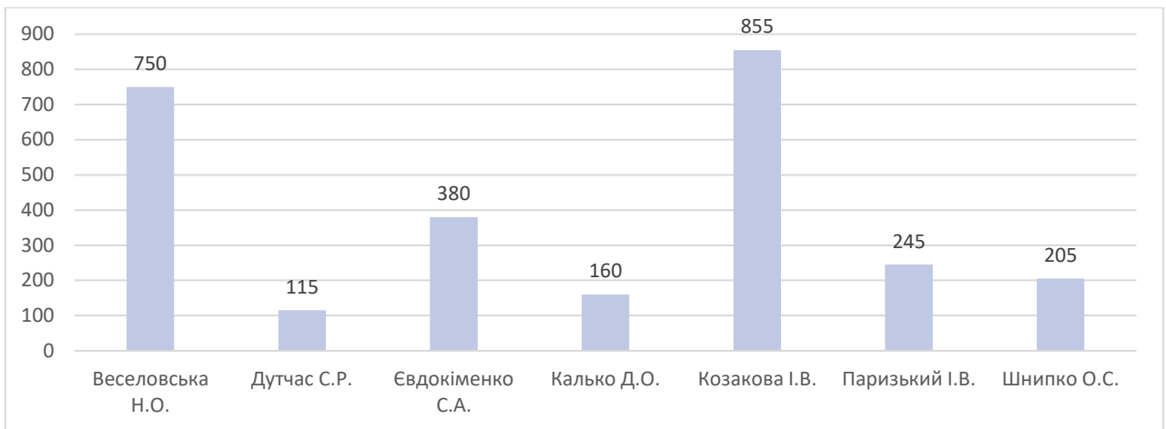
Рис.2. Рейтинг науково-педагогічних та педагогічних працівників кафедри кримінального права, кримінології, цивільного та господарського права за 2017-2022 роки, бали

Результати рейтингування науково-педагогічних та педагогічних працівників кафедри кримінального права, кримінології, цивільного та господарського права за 2017-2022 роки.